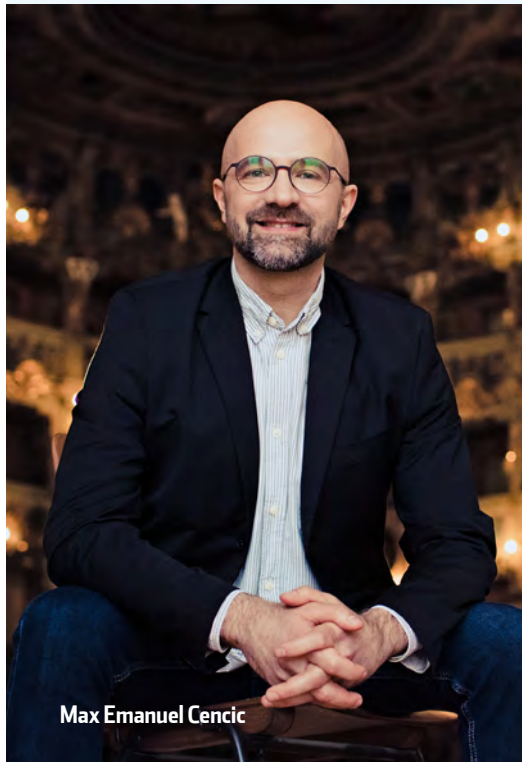
Max Emanuel Cencic