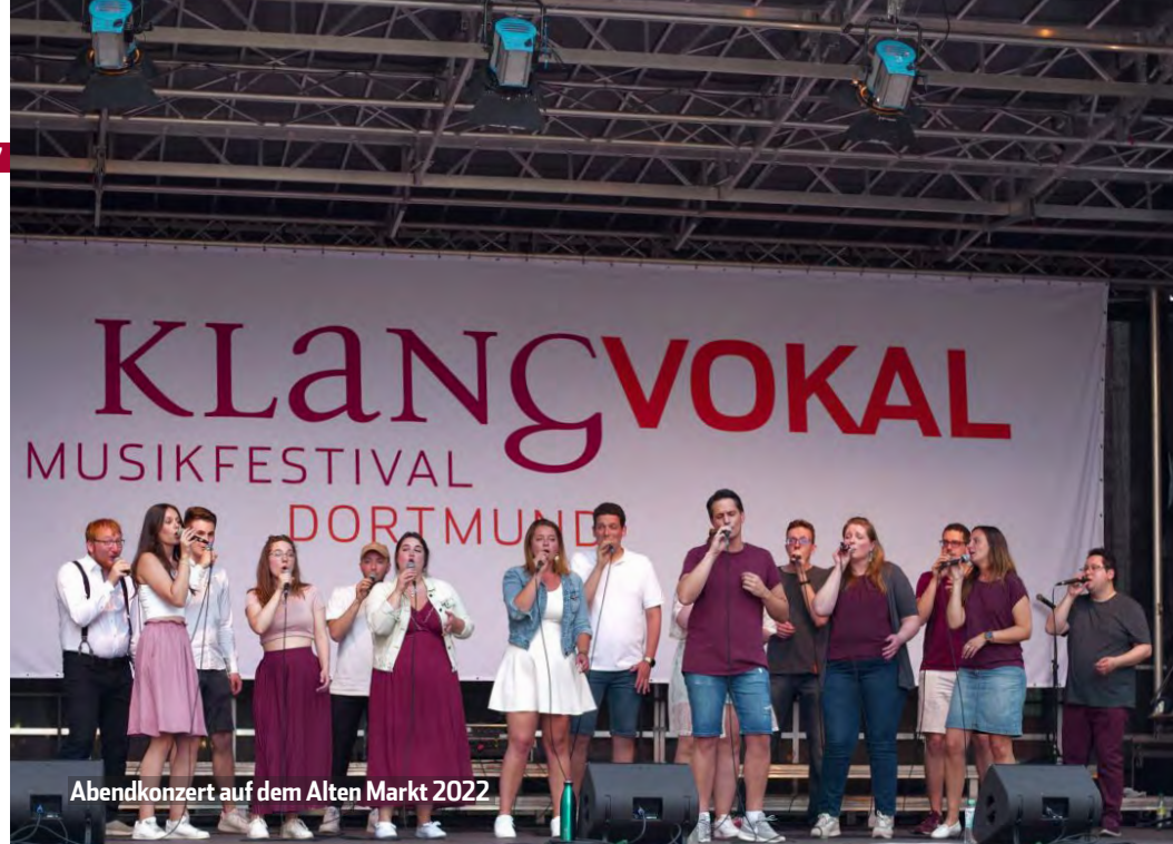
Abendkonzert auf dem Alten Markt 2022