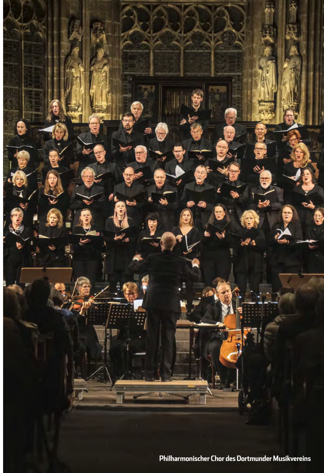
Philharmonischer Chor des Dortmunder Musikvereins