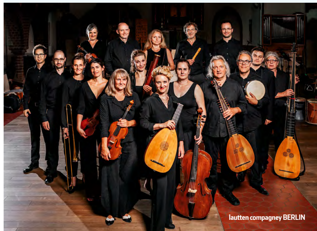
lautten compagney BERLIN