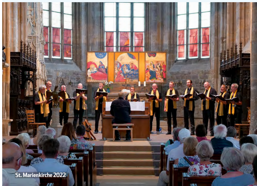
St. Marienkirche 2022

SAMSTAG, 10. JUNI ► 12.00 BIS 22.00 UHR ► CITY DORTMUND