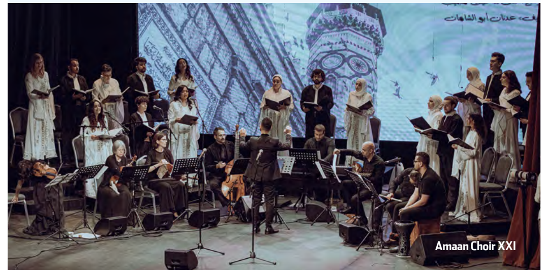
Amaan Choir XXI