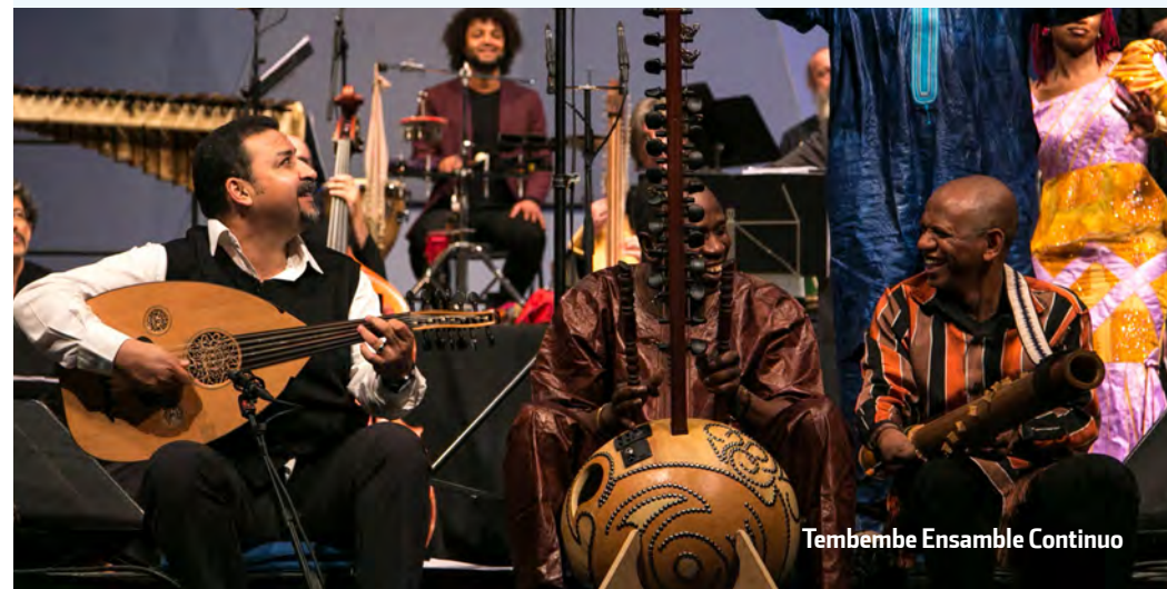
Tembembe Ensemble Continuo