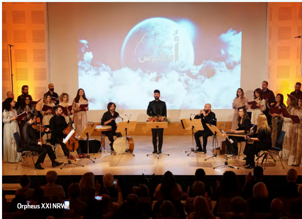
Orpheus XXI NRW

SAMSTAG, 16. DEZEMBER ► 19.30 UHR ► REINOLDIHAUS DORTMUND