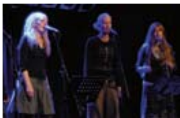
Ensemble chantik: a cappella beim Nachtkonzert in der St. Marienkirche

16.30 Uhr Projektchor der katho- lischen Kirchenchöre des Dekanats Dortmund, Ensemble Brass Cantabile (G)