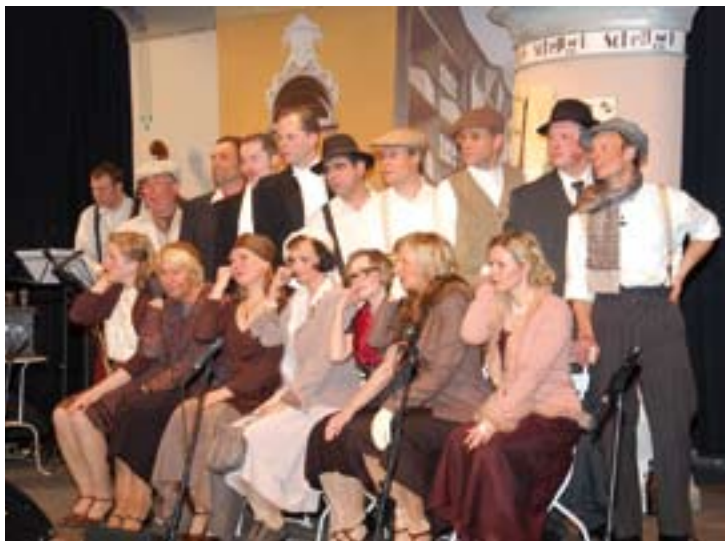
Schellack & Co: Gesang mit szenischer Einlage bietet das Ensemble in der St. Marienkirche.