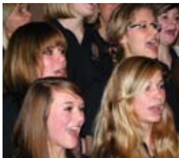
Clara's Voices: Der Schulchor zeigt auf der BMW-Bühne sein Können.

16.35 Uhr CHORGEMEINSCHAFT St. Antonius Merfeld (G)