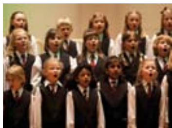
Kinderchor der Chorakademie auf der BMW-Bühne

17.10 Uhr Rudolf Steiner Schule: „Vokalensemble am Mergelteich“, Jugendprojektchor, Chor-AG & Instrumentalensemble (G/K)