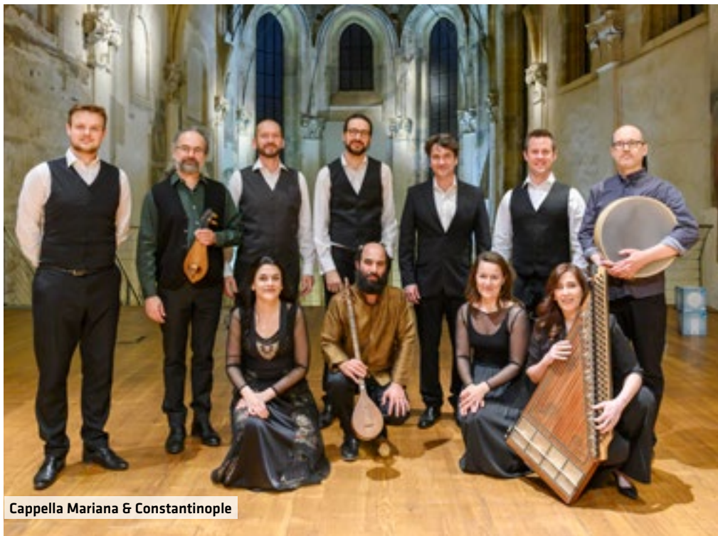
Cappella Mariana & Constantinople