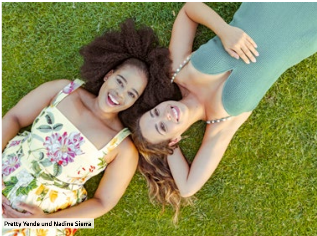
Pretty Yende und Nadine Sierra