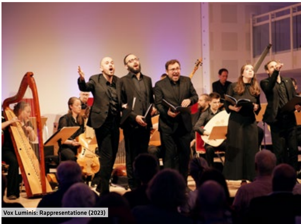
Vox Luminis: Rappresentazione (2023)