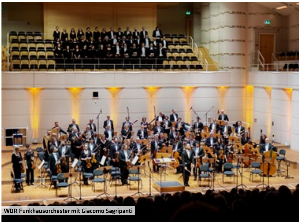
WDR Funkhausorchester mit Giacomo Sagripanti