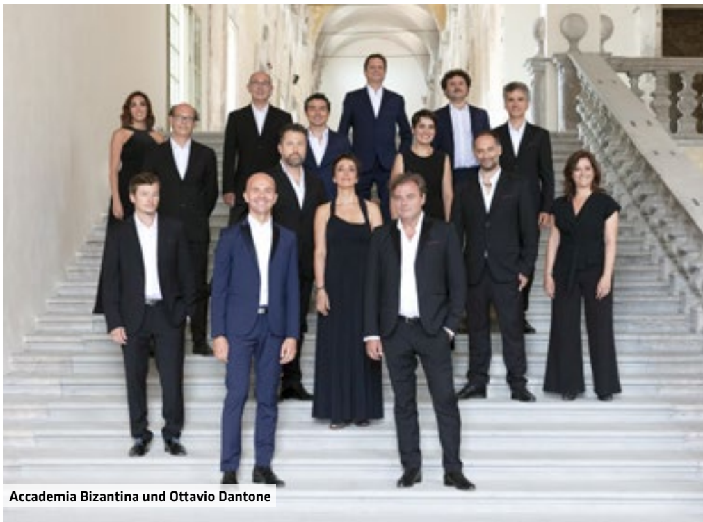
Accademia Bizantina und Ottavio Dantone