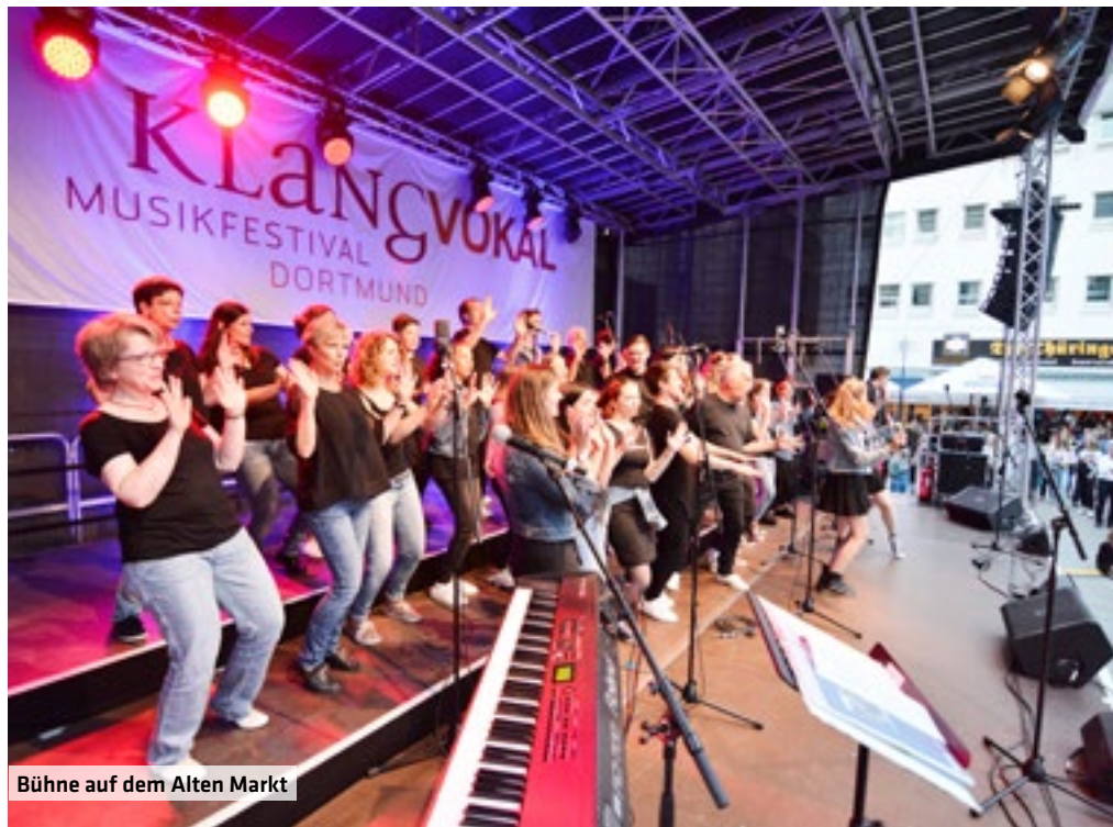
Bühne auf dem Alten Markt