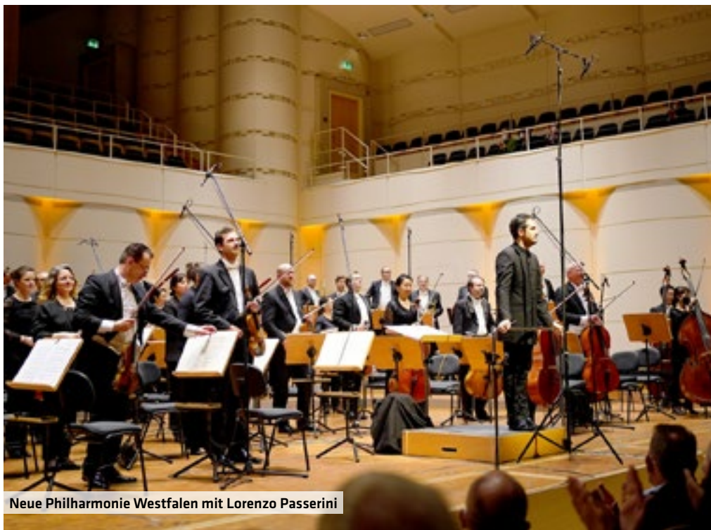
Neue Philharmonie Westfalen mit Lorenzo Passerini