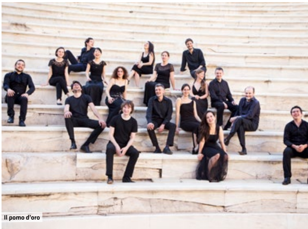
Il pomo d'oro