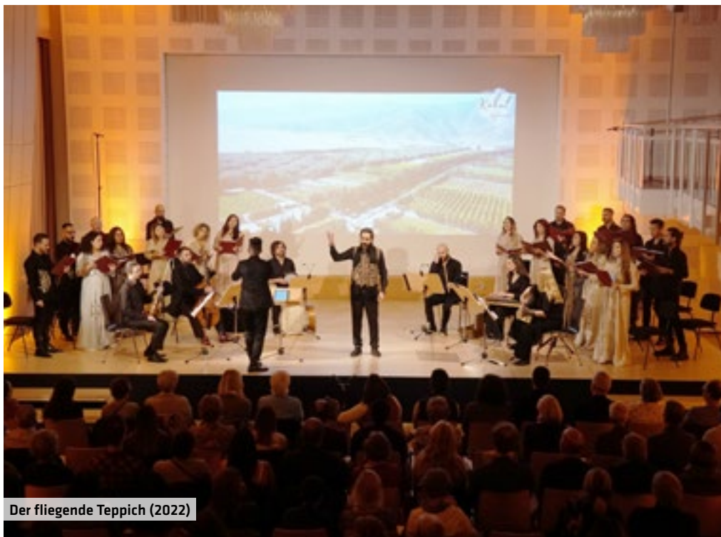
Der fliegende Teppich (2022)