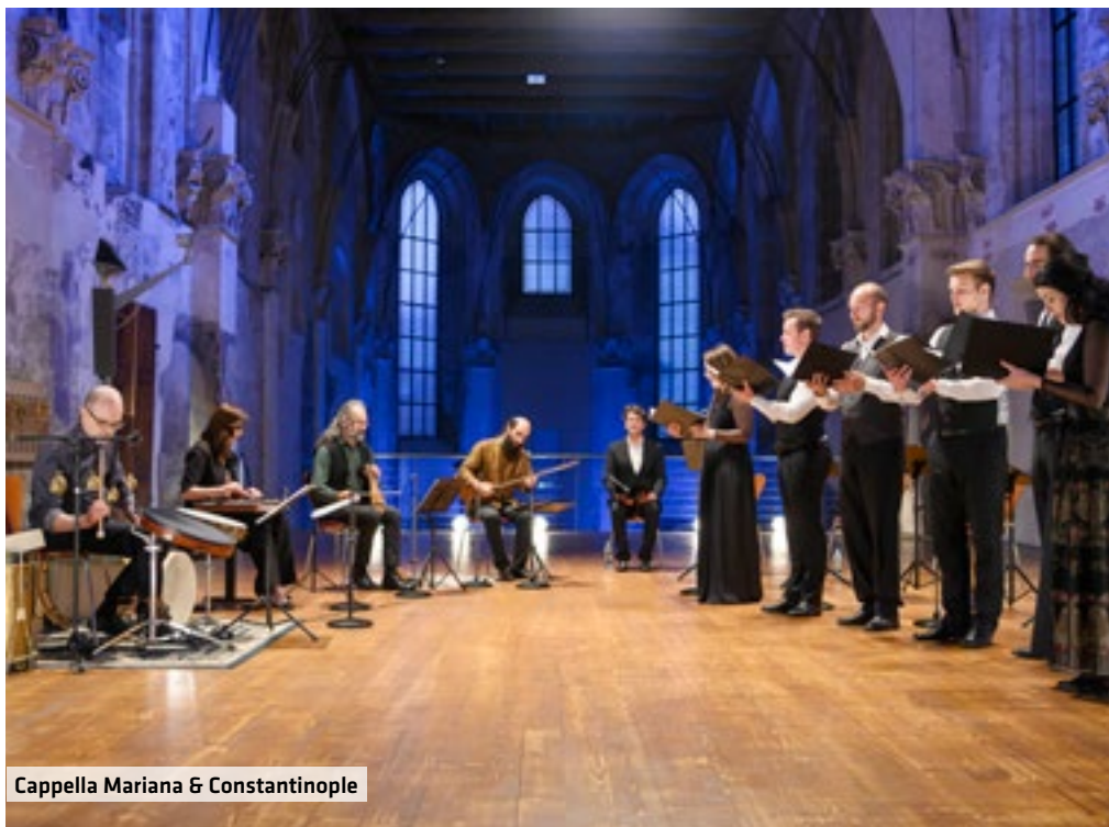
Cappella Mariana & Constantinople