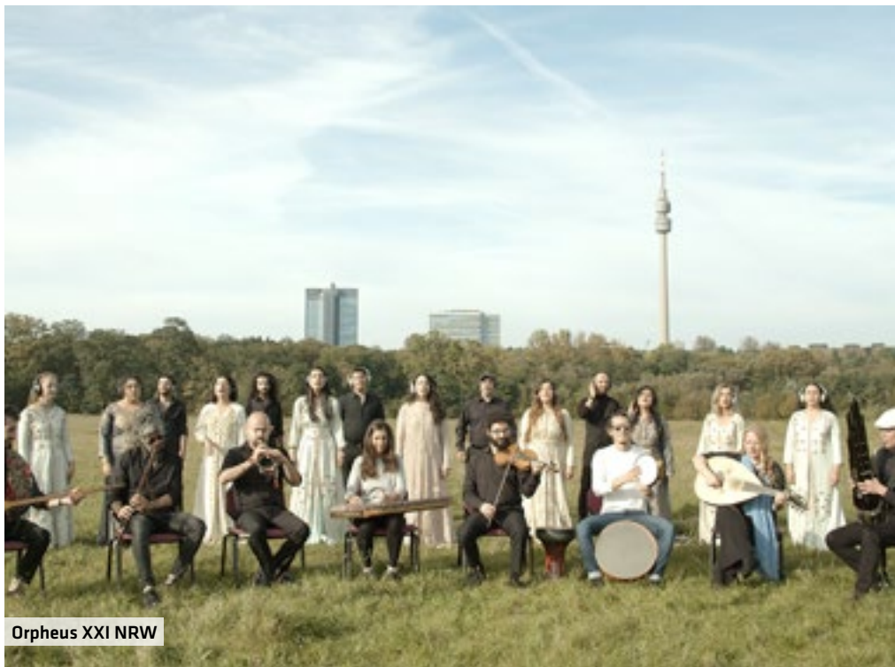
Orpheus XXI NRW