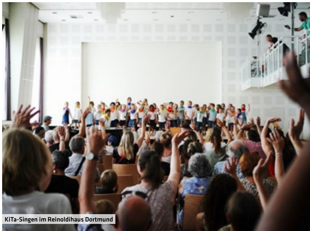
KiTa-Singen im Reinoldihaus Dortmund