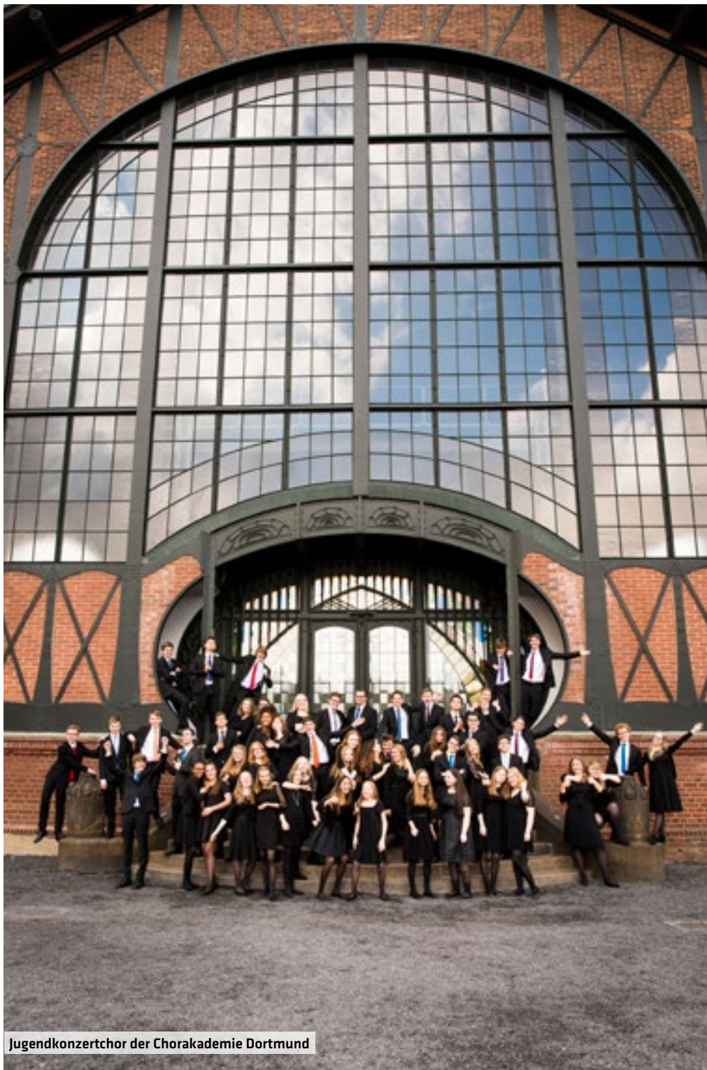
Jugendkonzertchor der Chorakademie Dortmund