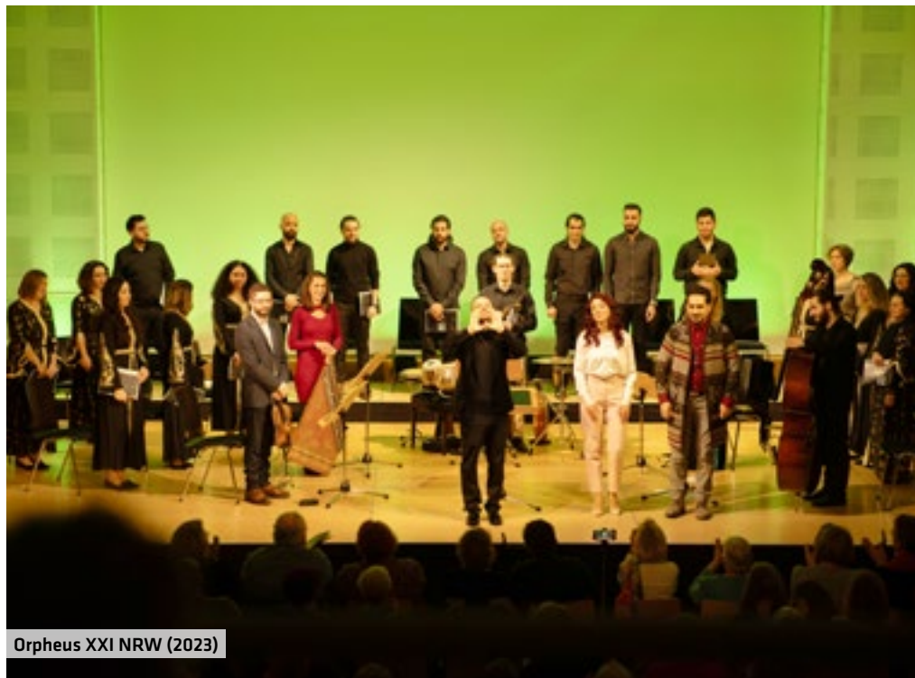
Orpheus XXI NRW (2023)