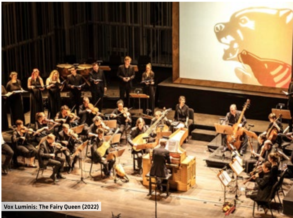
Vox Luminis: The Fairy Queen (2022)