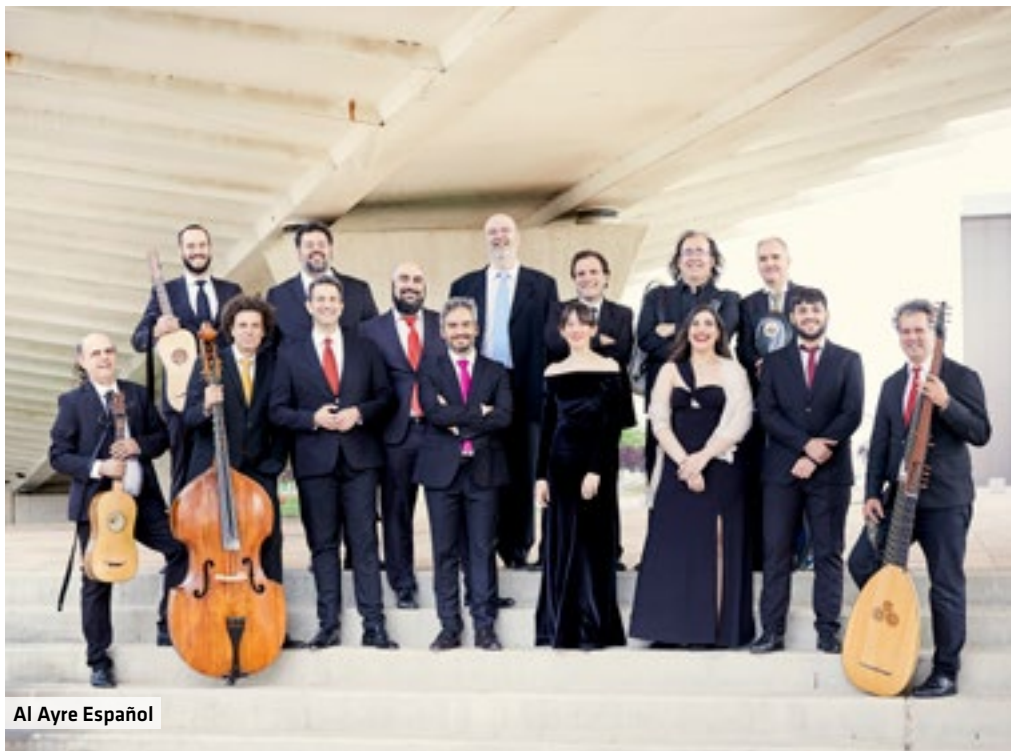
Al Ayre Español