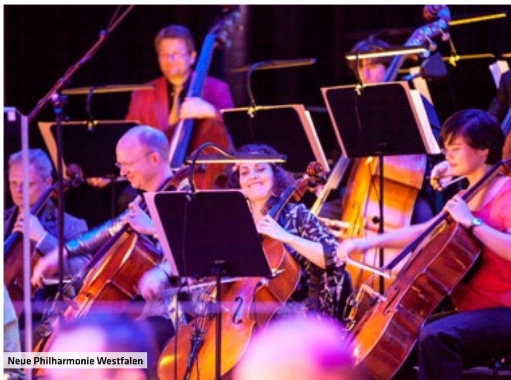
Neue Philharmonie Westfalen