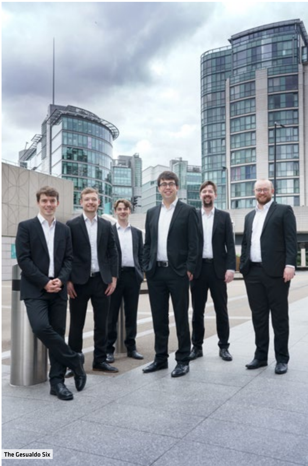
The Gesualdo Six

Musik der Renaissance und zeitgenössische Musik